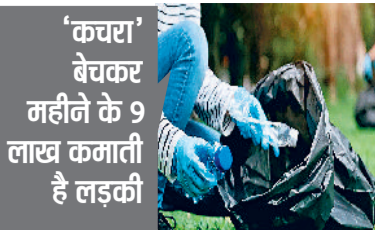
'कचरा' बेचकर महीने के 9 लाख कमाती है लड़की

फिलहाल जिस मरीज के ऊपर ये रिसर्च की गई उसकी मौत मिर्गी के इलाज के दौरान हार्ट अटैक से हुई थी और उसकी उम्र 87 साल थी। इसके लिए उन्होंने मरीज के सिर पर गतिविधि पर नजर रखने के उनके सिर पर एक उपकरण बांधा था, लेकिन हुआ कि प्रक्रिया शुरू होने से पहले ही उसकी मौत हो गई।