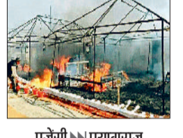
एजेसी ►► प्रयागराज

उत्तर प्रदेश के प्रयागराज में चल रहे महाकुंभ मेले में हादसे रुकने का नाम नहीं ले रहे हैं। रविवार को सेक्टर 19 में स्थित एक कल्पवासी टेंट में गैस सिलेंडर लीक होने से