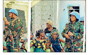
बमाको (माली)