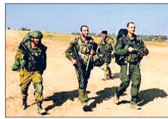
एजेंसी नई दिल्ली

इजराइल-हमास युद्ध विराम समझौते के तहत इजराइल सैनिक गाजा के आबादी वाले इलाकों से पीछे हटेंगे और फिलिस्तीनियों को इजराइल बलों की तरफ से निरीक्षण किए बिना, नेत्जारिम से होकर गुजरने वाली एक केंद्रीय सड़क से उत्तर की ओर जाने की अनुमति दी जाएगी। रविवार को एक इजराइल अधिकारी ने कहा कि इजराइल सेना ने गाजा के एक महत्वपूर्ण गलियारे से हटना शुरू कर दिया है, जो हमास के साथ युद्ध विराम समझौते का हिस्सा है। इजराइल ने युद्ध विराम के हिस्से के रूप में नेत्जारिम गलियारे से अपनी सेना हटाने पर सहमति जताई, यह एक भूमि पट्टी है जो उत्तरी गाजा को दक्षिणी से विभाजित करती है।